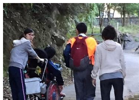
学校からの帰り道