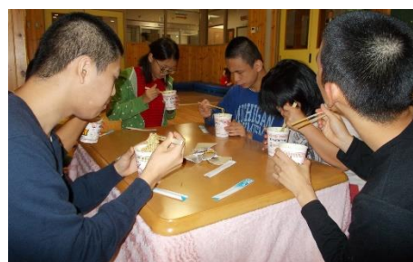
だんらんのひと時

また、同一建物内にある、成人施設と協力し、児童から成人への一貫した支援を提供します。