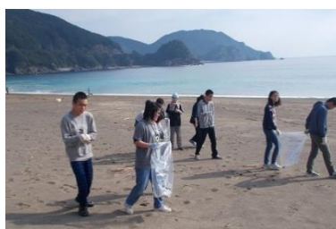
奉仕活動（大浜海岸清掃）