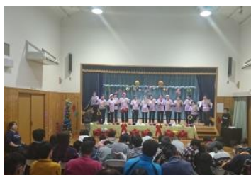
地域交流活動（クリスマス会）