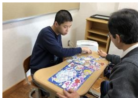
動言療育（言語聴覚士）

恣意的な訓練を排除して、出来る限り自らの選択と、個々の特性に応じた日中活動支援や、各種セラピストによる療育、隣接する支援学校と連携をとった支援を行います。